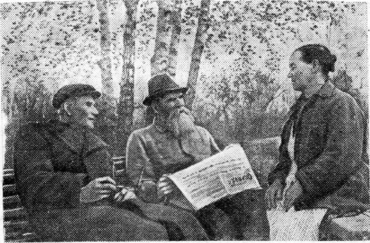
МОСКВА. Внесенный Советским правительством на утверждение Верховного Совета СССР проект Закона о государственных пенсиях отвечает интересам миллионов советских людей и имеет огромное политическое значение.

Оживленно обсуждая этот проект, рабочие, колхозники, интеллигенция, воины Советской Армии и Флота видят в нем проявление неустанной заботы Коммунистической партии и Советского правительства о благе народа. Проект Закона находит горячее одобрение у советских людей.