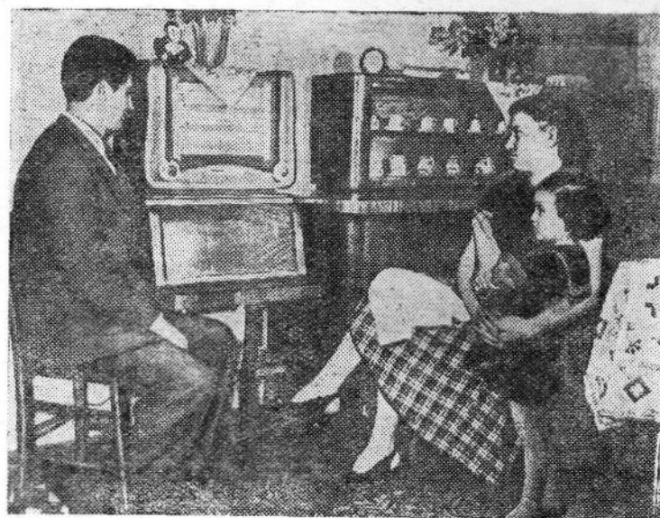
Многие трудящиеся Народной Республики Болгарии регулярно слушают передачи московского радио на болгарском языке.