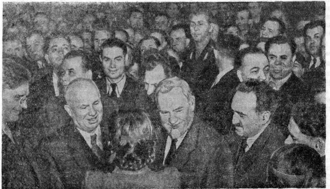
МОСКВА. XX СЪЕЗД КОММУНИСТИЧЕСКОЙ ПАРТИИ СОВЕТСКОГО СОЮЗА. На снимке: члены Президиума съезда во время перерыва между заседаниями среди делегатов съезда.

—В ответ на заботу нашей партии и правительства о повышении материального и культурного уровня трудящихся, — говорит она, — я лично обязуюсь выполнять задания на 150 и более процентов, выпускать продукцию только хорошего и отличного качества, быть всегда примером в труде. Это будет мой вклад в общее дело и благодарностью нашей родной Коммунистической партии.