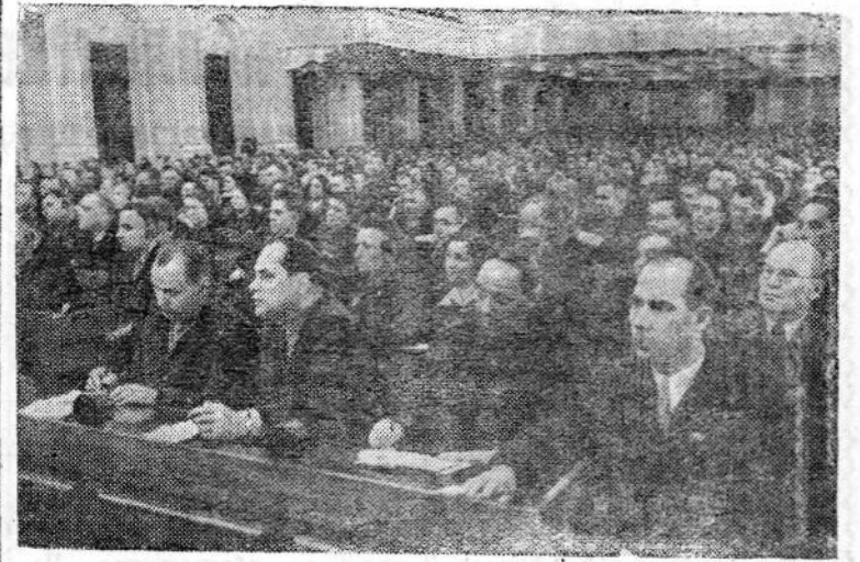
XX СЪЕЗД КОММУНИСТИЧЕСКОЙ ПАРТИИ СОВЕТСКОГО СОЮЗА. На снимке: в зале заседаний.