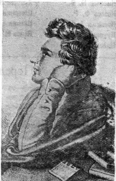
ными легендами, древней и новой поэзией.

Детство поэта прошло в небогатой семье. Он рано начал писать стихи, увлекался народными песнями и сказками, старин-