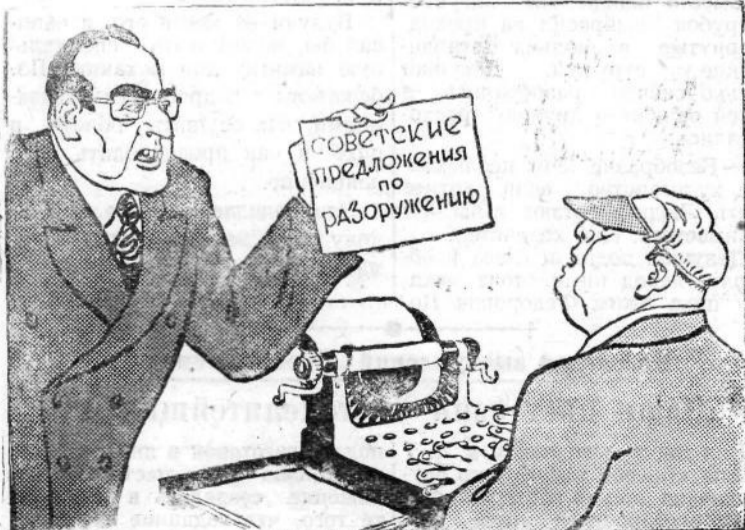
Немедленно переврите это на английский язык!... Рис. К. Елисеева.