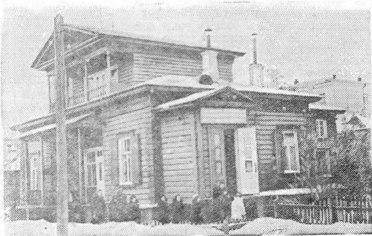
БАШКИРСКАЯ АССР. Уфимский мемориальный дом-музей В. И. Ленина в 1955 году посетило до сорока тысяч человек. Здесь побывало более тысячи экскурсий с заводов и фабрик, колхозов и учебных заведений Башкирии и соседних областей. На снимке: мемориальный дом-музей В. И. Ленина.

Наряду с гидроэлектростроительством разрабатывается программа строительства мощных тепловых электростанций. Сейчас в стране строится более 140 гидравлических и тепловых станций, общая мощность которых нечислится несколькими десятками миллионов киловатт.