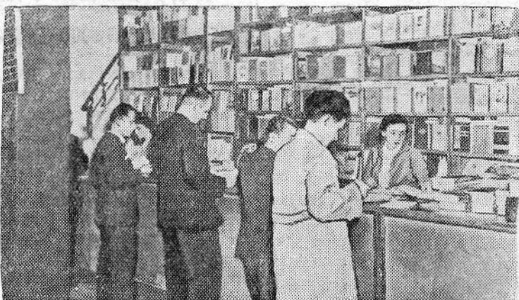
1. В Народной Республике Албании большой популярностью пользуются советское искусство и советская литература. Многие рабочие, служащие, студенты изучают русский язык и читают в подлинниках книги русских классиков и современных советских писателей.

На заседании было отмечено, что в настоящее время в городе полным ходом идут работы по восстановлению жилых зданий. В городе отремонтировано и уже заселено более 3 тысяч квартир. В восстановительных работах принимают участие около 12 тысяч рабочих. Сейчас в Будапеште нет ни одного поврежденного дома, в котором не производился бы ремонт. В снабжении населения Будапешта продовольствием не наблюдается никаких перебоев. Имеются достаточные запасы, которые позволяют обеспечить нормальное снабжение и в будущем.