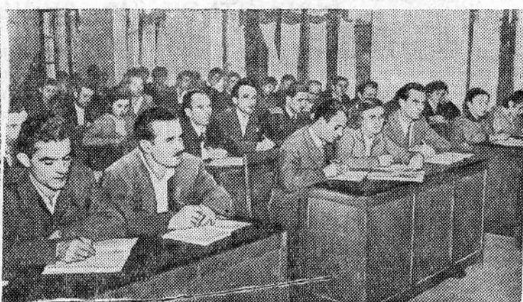
2. В последние годы в Народной Республике Албании организована подготовка квалифицированных кадров без отрыва от производства. В столице республики — Тиране создан Вечерний экономический институт. В нем занимаются передовики производства, хозяйственные руководители, директора предприятий.