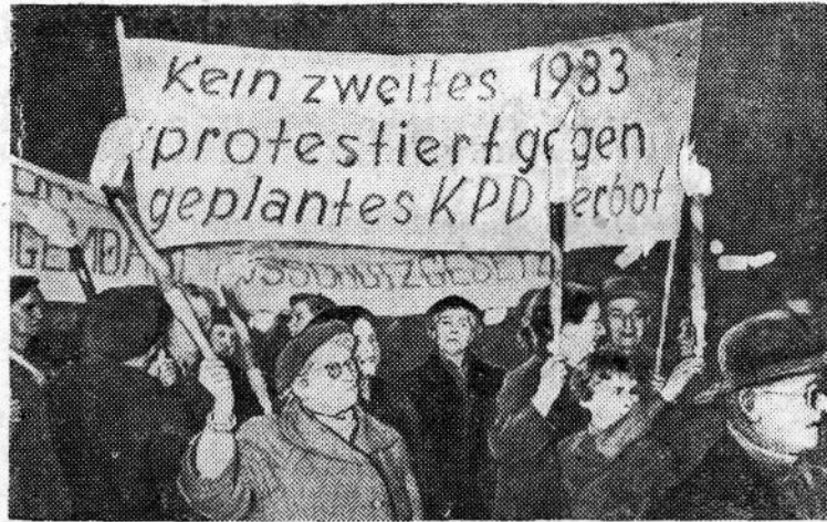
ФЕДЕРАЛЬНАЯ РЕСПУБЛИКА ГЕРМАНИЯ. Факельное шествие протеста жителей Бремена против введения воинской повинности и запрещения КПГ.

Николай Николаевич Златовратский (1845—1911) — известный русский писатель-народник. В книгу вошли его воспоминания «Детские и юные годы», освещающие события 60-х гг. прошлого столетия, цикл автобиографических очерков и рассказов «Как это было», а также «Литературные воспоминания», в которых запечатлены образы современников автора.