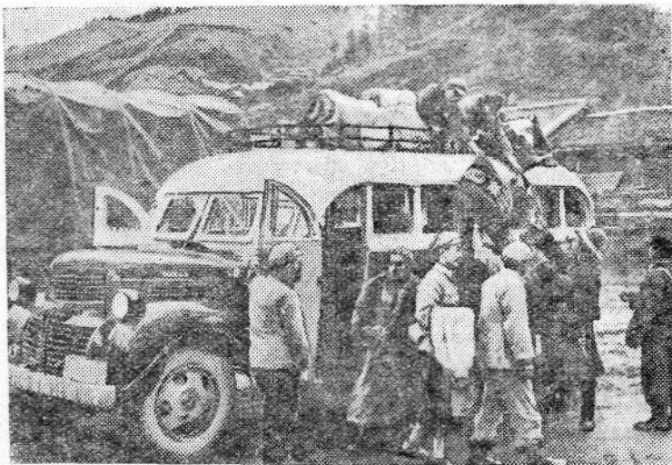
КИТАЙСКАЯ НАРОДНАЯ РЕСПУБЛИКА. Молодой город Шуацзинсы — административный центр Тибетского автономного округа Аба в провинции Сычуань. На снимке: на автобусной станции в Шуацзинсы, расположенной на трассе шоссе Чэнду-Аба.