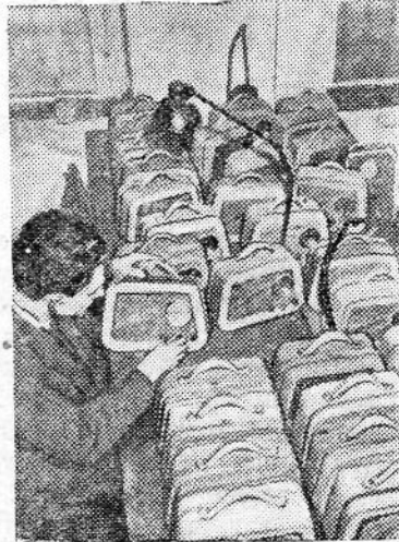
ПОЛЬСКАЯ НАРОДНАЯ РЕСПУБЛИКА. Познанский промкооператив технико-металлических изделий изготовил первую партию походных радиоприемников «Турист-Б-1». Они имеют 5 ламп, работают на средних и длинных волнах. Вес аппарата — 3,75 килограмма. На снимке: проверка готовых радиоприемников.