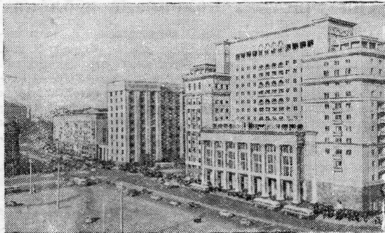
Москва сегодня. Вид на улицу Горького со стороны Кремля.