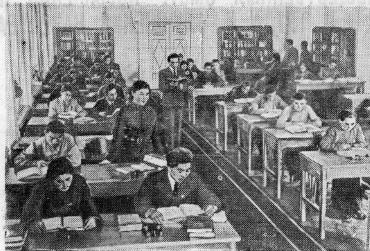
Монгольская Народная Республика. В читальном зале Государственной центральной библиотеки имени И. В. Сталина в Улан-Баторе.