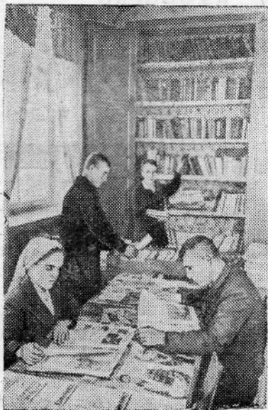
Сталинская область. Построенный в этом году клуб сельхозартели «Червоный прапор» стал культурным центром села Антоновки Марьинского района. На снимке: в библиотеке колхозного клуба.

Тов. Данилова подробно рассказала участникам совещания о том, как прядильщицы ее бригады довели выработку ос-