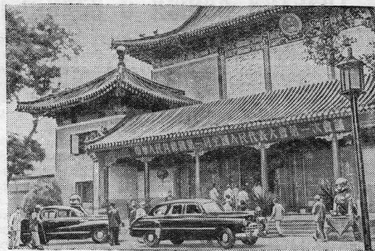
Пекин. Дворец Хуайжэнтан, в котором проходили заседания Первой сессии Всекитайского собрания народных представителей и где была принята первая Конституция Китайской Народной Республики.