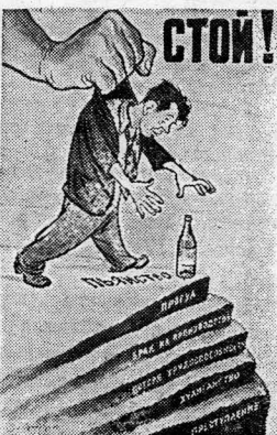
Плакат художников Б. Ефимова и Н. Долгорукова, выпущенный ИЗОГИС.