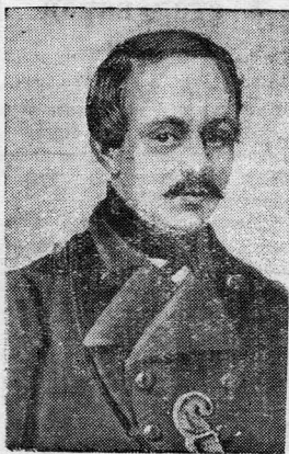
Михаил Юрьевич ЛЕРМОНТОВ (1814—1841 г.г.) (К 140-летию со дня рождения)

Общественность нашего завода деятельно готовится к проведению юбилейной даты — 140-летию со дня рождения великого русского поэта М. Ю. Лермонтова.