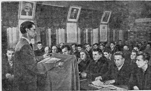
Пензенская область. В городе Каменка открылся вечерний Университет марксизма-ленинизма. Более ста коммунистов и беспартийных повышают здесь свои политические знания.

На снимке: на лекции в вечернем университете.