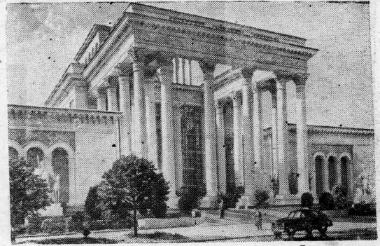
Москва. Всесоюзная сельскохозяйственная выставка. Павильон «Северный Кавказ».