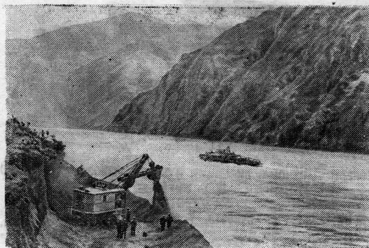
Казахская ССР. В разгаре подготовительные работы к строительству Бухтарминской гидроэлектростанции на Иртыше.

С. ЛЯПИН, начальник бюро рекламаций ОТК.