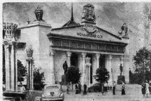
Москва. Всесоюзная сельскохозяйственная выставка. Павильон «Молдавская ССР».