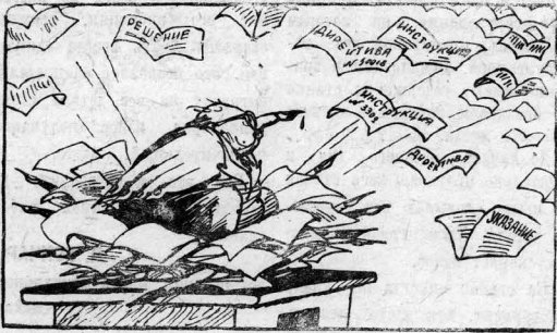
Высживает круглый год. Рис. Ю. Узбаякова.

«У нас есть еще немало работников, которые привыкли только заседать и писать резолюции. Но они не любят и не умеют работать с людьми, не откликаются на насущные запросы трудящихся, не выкают глубоко в детали. Такие чиновники не знают дела, но могут давать директивы по любому вопросу — и как собак стричь, и как кур донть».