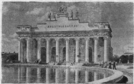
Москва. Всесоюзная сельскохозяйственная выставка. Павильон «Животноводство».