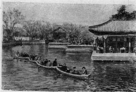
Китайская Народная Республика. Созданный в окрестностях Пекина 800 лет назад парк Ихэюань является ныне излюбленным местом отдыха трудящихся столицы. В праздники и по выходным дням десятки тысяч пекинцев устремляются в Ихэюань. На снимке: у лавильона, где отдыхающие пьют чай.

ский князь Дмитро, безымянный гонец, везущий грамоту Богдана Хмельницкого в Москву, и поэт Тарас Шевченко; это люди нашей эпохи, советские люди — воины и создатели («На поле Куликовом», «Гонец», «Встреча у ворот», «Вступление», «Парад Победы», «На Ленинских горах»). В стихотворении «Первый день» воплощена мысль о том, что Октябрьская революция открыла украинскому народу дорогу в будущее. В стихотворении «В одно осеннее утро» отражена тема воссоединения украинских земель в едином Советском государстве.