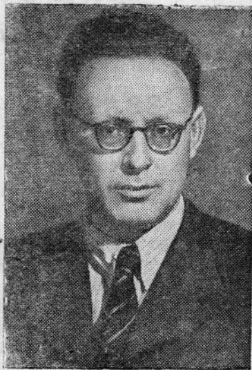
Гроссмейстер Михаил Ботвинник, Прессклише ТАСС.