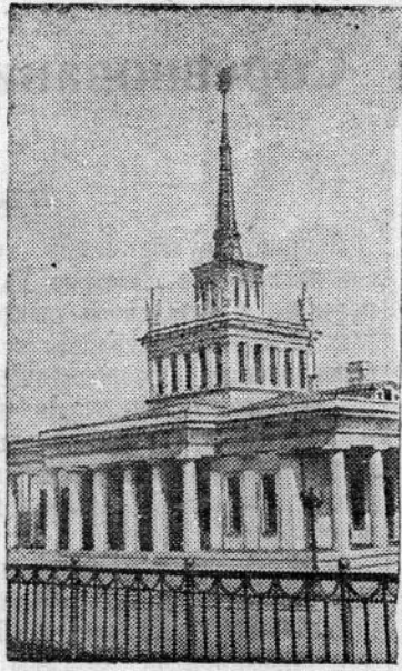
Московская область. На станции Ленинская Московско-Донбасской железной дороги (близ Горок-Ленинских) воздвигнуто здание вокзала-памятника великому вождю Владимиру Ильичу Ленину.

На снимке: новый вокзал.