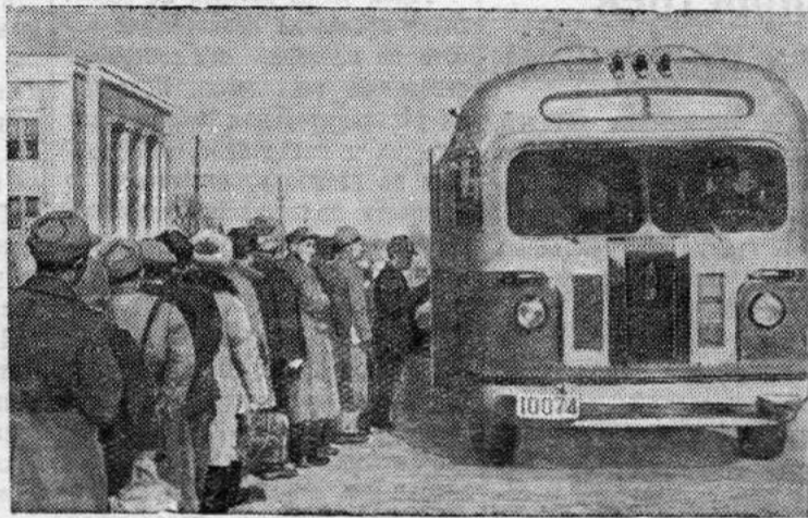
Пхеньяна. По улицам столицы Корейской Народно-Демократической Республики курсируют автобусы «ЗИС-155», доставленные из Советского Союза.