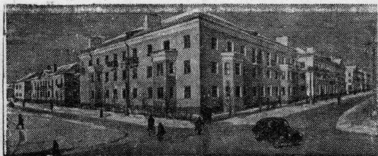
Свердловская область. Новые дома в г. Первоуральске.

Собравшиеся с большим интересом прослушали лекцию на тему: «Постановление сентябрьского Пленума ЦК КПСС о мерах дальнейшего развития сельского хозяйства СССР».