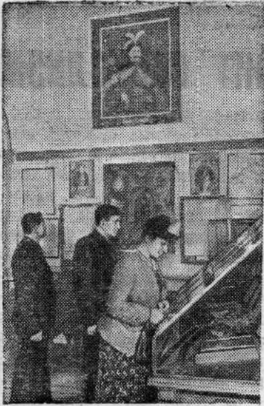
Москва. На снимке: посетители в залах Государственного исторического музея, посвященных Украине.