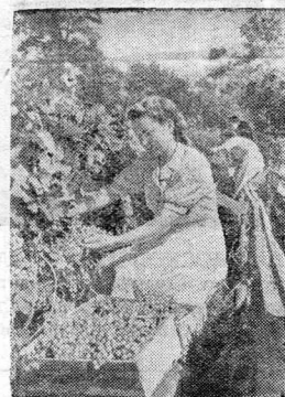
Молдавская ССР. В кишиневском училище виноделия и виноградарства.