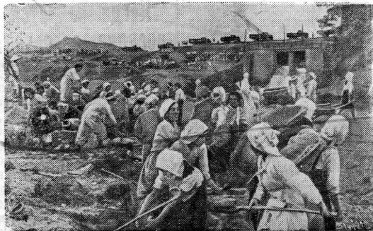
Корейская Народно-Демократическая Республика. Корейский народ, одержав победу в освободительной Отечественной войне, приступил к мирному труду. Восстанавливаются города и поселки, фабрики и заводы, водохранилища, разрушенные американскими воздушными пиратами.

На снимке: крестьяне восстанавливают плотину Суанского водохранилища.