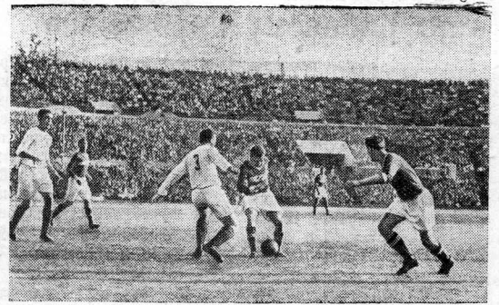
В Москве состоялась товарищеская встреча по футболу между сборной командой Чехословакии и командой «Спартак» (Москва). Встреча закончилась победой советских футболистов со счетом 2:0. На снимке: момент игры.