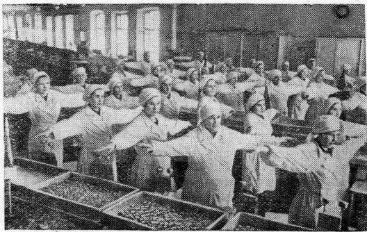
Москва. На кондитерской фабрике «Красный Октябрь» введена ежедневная производственная гимнастика. Перед началом работы проводится вводная гимнастика, во время работы устраиваются «физкультпаузы».