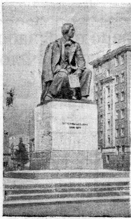
Ленинград. Памятник Н. Г. Чернышевскому.

21 июля во Всесоюзной Государственной библиотеке иностранной литературы открылась выставка, посвященная 125-летию со дня рождения Н. Г. Чернышевского. Выставки, посвященные Чернышевскому, открыты также в Государственной библиотеке СССР имени В. И. Ленина и в Государственной Исторической библиотеке.