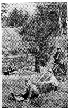
ЧЕЛЯБИНСК. Многие рабочие и слухачие тракторного завода занимаются в студии художественной живописи и рисунка при Дворце культуры.

Партийное бюро должно изменить свое отношение к руководству стенной газетой, добиться, чтобы стенгазета «Мотор» выходила не реже двух раз в месяц и широко освещала все вопросы работы партийной организации и коллектива цеха, ход социалистического соревнования за выполнение взятых обязательств, подвергая резкой критике недостатки в работе.