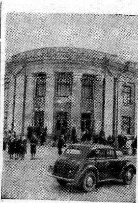
Сталинская область. В гор. Горловке расширяется сеть магазинов. Недавно на улице имени Сталина открыт большой универсам, в котором имеются самые разнообразные товары. На снимке: у входа в новый универсам.