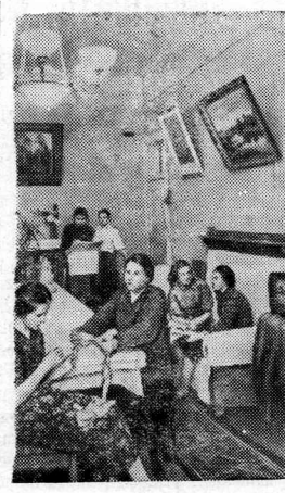
Одним из проявлений заботы Советского государства о здоровье трудящихся является создание сети ночных профилакториев. За восемь лет профилакторий Московского шелкоткацкого комбината «Красная Роза» обслужила более 2000 человек.

На снимке: в комнате отдыха профилактория.