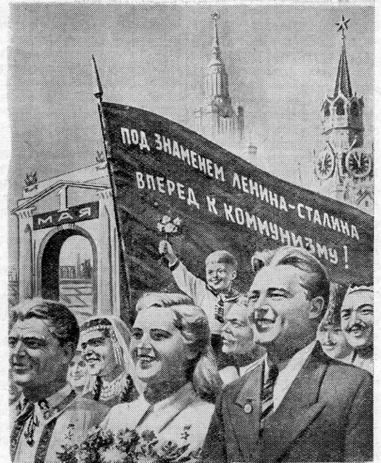
Рисунок Н. Павлова.

Дубы-часовые растут. Посмотришь на площади Нашей столицы, Заглянешь в любое село — Счастливое детство смеется, резвится, Светло нашим детям, тепло. В колоннах могучих Шагаем рядами. Повсюду оркестры гремят. И словно огни коммунизма, над нами Родные знамена горят. День Первого мая.