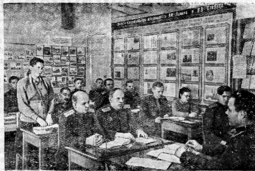
ВЛАДИВОСТОК. Рабочие и служащие 3-го отделения Приморской железной дороги изучают исторические материалы XIX съезда КПСС.

В заключение в блоноте напечатана статья Д. Новакова в помощь изучающим книгу товарища И. В. Сталина «Экономические проблемы социализма в СССР» — «Основной экономический закон современного капитализма».