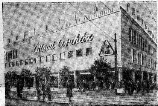
ВЕНГРИЯ. Уйпешт—один из пригородов венгерской столицы Будапешта. После включения его в черту города в нем построено много жилых и административных зданий, разбиты новые парки. Удобное сообщение связало Уйпешт с центром столицы.