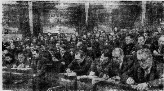
Москва. Во Дворце культуры автозавода имени Сталина помещается филиал Московского университета марксизма-ленинизма при Пролетарском райкоме ВКП(б). На снимке: слушатели первого курса на лекции.