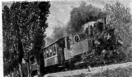
Закарпатская область. Началось движение поездов на «Малой Закарпатской» детской железной дороге.

На снимке: поезд выходит из топовой аллеи.