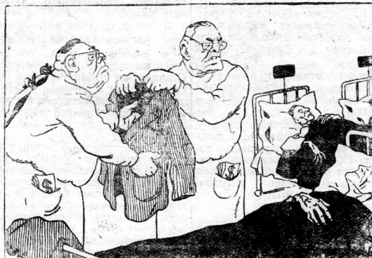
«Этого больного надо выписать. У него ничего уже нет... ни одного доллара!».