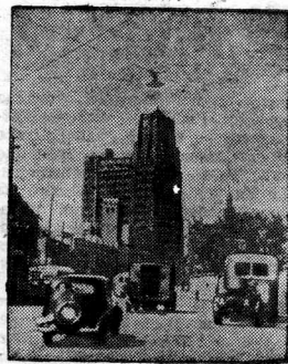
КИТАЙСКАЯ НАРОДНАЯ РЕСПУБЛИКА Шанхай, на улице Наньцзинду.