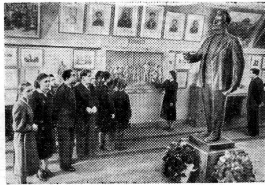
МОСКВА. В музее М. И. Калинина открылись новые залы, в которых собраны документы, фотографии и другие материалы, показывающие жизнь и деятельность М. И. Калинина до Великой Октябрьской социалистической революции.

С большим воодушевлением делегаты конференции приняли приветствие вождю народов товарищу И. В. Сталину.