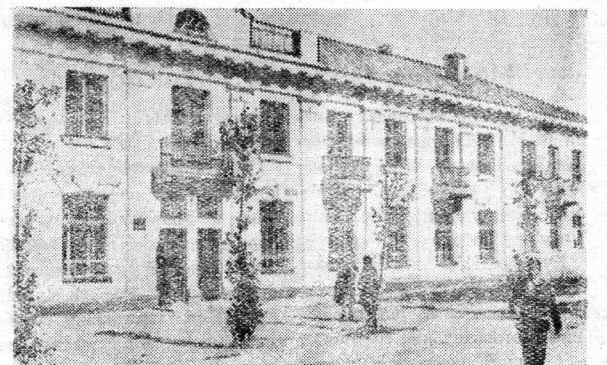
НА СНИМКЕ: Здание вечернего филиала Алтайского института сельскохозяйственного машиностроения.

Золотыми словами записано в Сталинской Конституции право советских граждан на образование. Проявление сталинской заботы о повышении культурного уровня трудящихся мы видим в создании широкой сети вечерних общеобразовательных школ, техникумов, высших учебных заведений. В нашей стране каждому гражданину, желающему учиться, предоставлена возможность получить высшее образование в дневном институте, или в вечернем и заочном, сочетая учебу с работой на производстве.