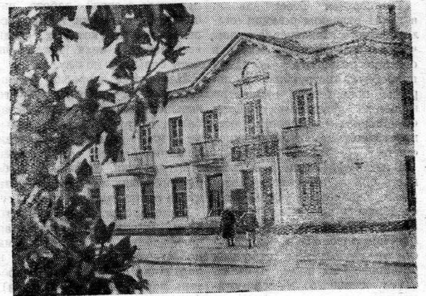
НА СНИМКЕ: Один из жилых домов тракторозаводцев по улице имени Сталина с помещением для аптеки.