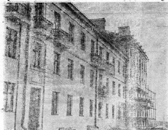
НА СНИМКЕ: Новый 64-квартирный дом для трудящихся завода, который будет сдан в эксплуатацию в 1950 году.

На примере работы библиотечной сети одного нашего завода можно видеть те огромные возможности для просвещения и знаний, какие предоставляет советским людям Сталинская Конституция.