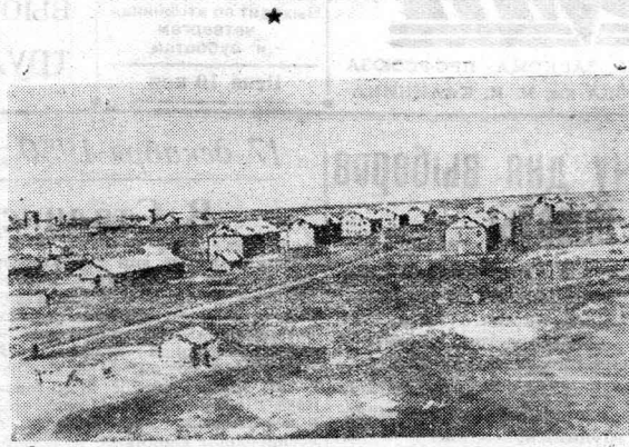
Так выглядел Восточный поселок нашего завода в 1942 году. По линии, проходящей вдоль всего снимка, сейчас построена главная улица поселка — имени Сталина.