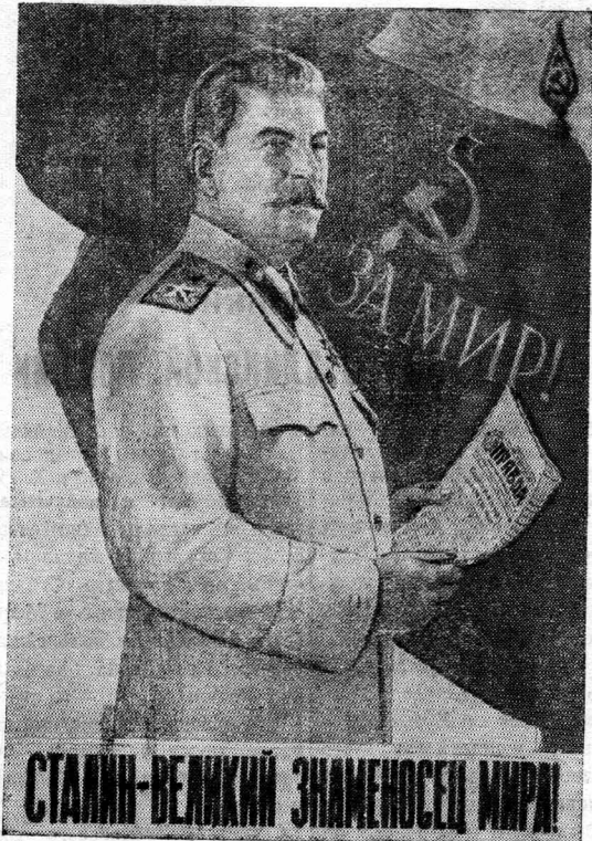
СТАЛИН — ВЕЛИКИЙ ЗНАМЕНОСЕЦ МИРА!