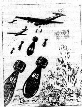
Посев в Корее...