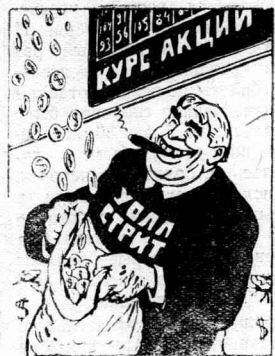
...урожай в Нью-Йорке. Рис. С. Чистякова.