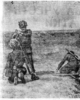
КОРЕЯ. Минометчики Народной армии Кореи на народно-демократической республике.