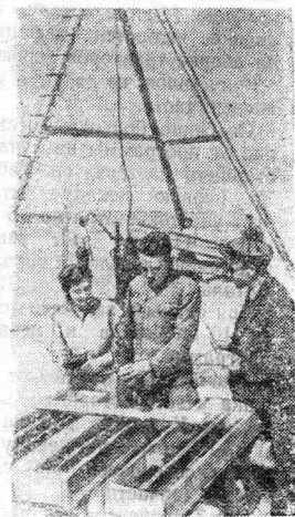
СТАЛИНГРАД. На месте предстоящей стройки Сталинградской гидроэлектростанции развернулись изыскательные работы.

На снимке: бурение разведочной скважины на месте, где будет бетонная плотина.