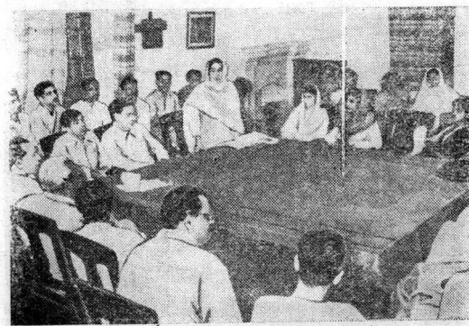
ПАКИСТАН. В городе Лахоре развернулось движение в защиту мира. В нем принимают участие тысячи людей — представители всех слоев населения. Активно проводится сбор подписей под Стокгольмским Воззванием Постоянного Комитета Всемирного конгресса сторонников мира.

Вот уже 2 недели как продолжается забастовка батраков 5 сельскохозяйственных провинций Италии. Бастует около 200 тыс. трудящихся, занятых на уборке риса. Батраки требуют прекращения увольнений, к которым прибегают помещики в качестве репрессивных мер против неугодных им батраков, оказания бесплатной медицинской помощи сельскохозяйственным рабочим и их семьям и т. д.