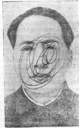
МАО ЦЗЕ-ДУН — Председатель Центрального Народного Правительства Народной республики Китая.

рессии против Китайской народной республики, оккупировав китайский остров Тайван (Формозу) и затем обстреляв с воздуха мирные китайские города. Они же посылают оружие, танки и самолеты фран-