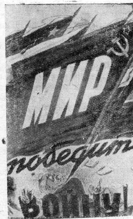
Планат работы художника К. Иванова, выпущенный Государственным издательством «Искусство».