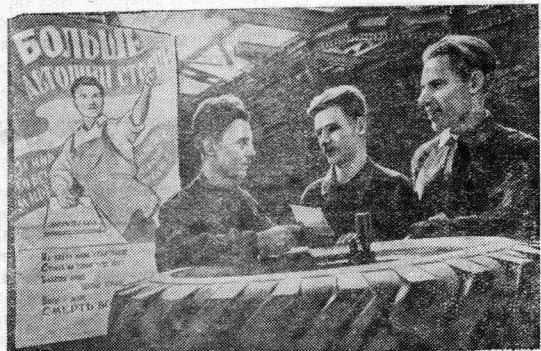
Сотни стахановцев Московского шинного завода стали на трудовую вахту мира.