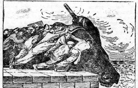
«Танки Трумэна — на дно».