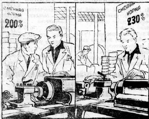
С кем поведешься, Рис. Ю. Узбякова.