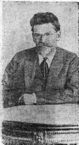
М. И. Калинин. (1923 год).

В годы мирного строительства М. И. Калинин стойко и последовательно боролся за осуществление ленинско - сталинской политики социали-